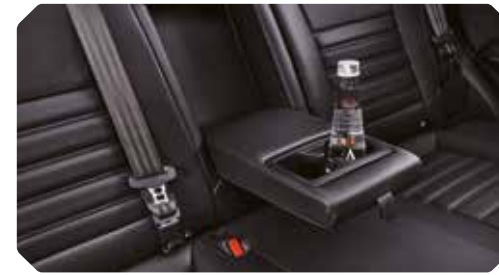
Centrale armsteun achteraan