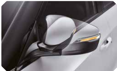
Elektrisch verstelbare en inklapbare buitenspiegels