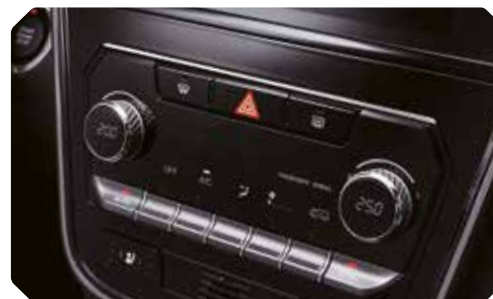
Automatische dual-zone airconditioning