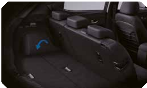
Verstelbare koffervloer neergeklapt