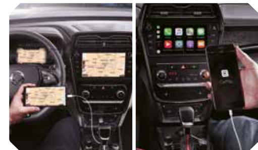
Google Android Auto en Apple CarPlay