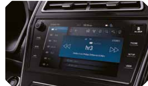
9,2" touch screen met navigatie