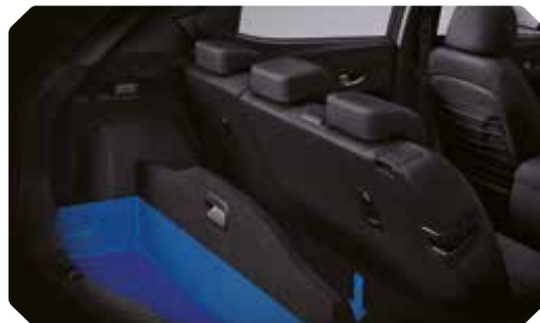
Verstelbare koffervloer – positie 1