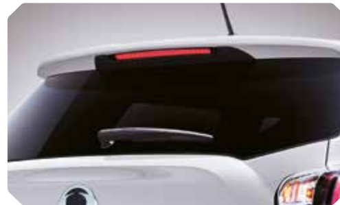
LED-remlicht bovenaan de kofferklep