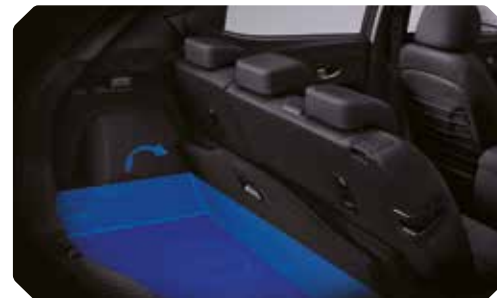
Verstelbare koffervloer – positie 2