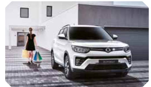
Automatische centrale vergrendeling