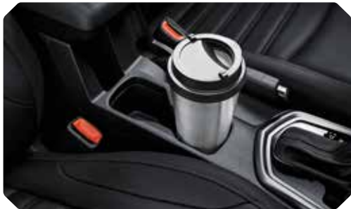
Bekerhouders in middenconsole