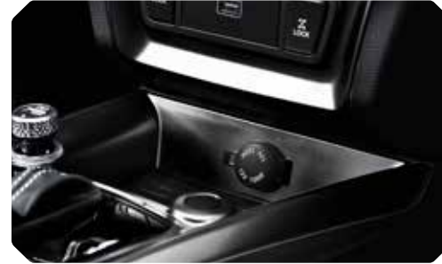
Middenconsole met opbergvak