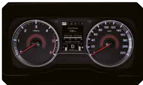
Analoog instrumentenpaneel (3,5" mono LCD)