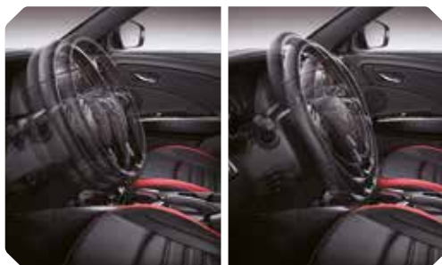
In de hoogte en diepte verstelbaar stuurwiel