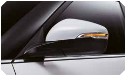
LED-richtingaanwijzers op de buitenspiegels