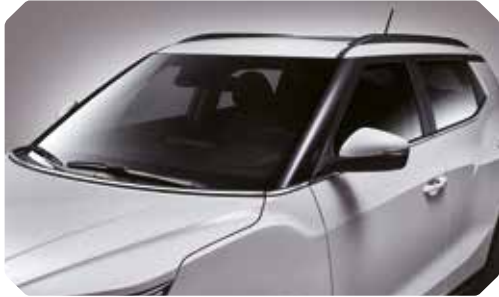
Verchroomde sierlijst aan de motorkap en de onderkant van de zijruiten