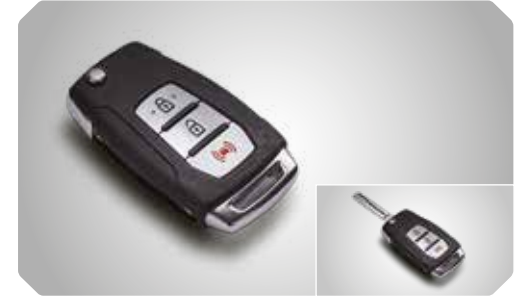
Smart key-systeem met opvouwbare sleutel