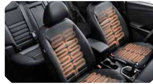
Verwarmde zetels vooraan