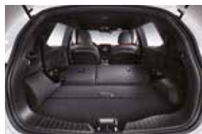
2de rij volledig neergeklapt