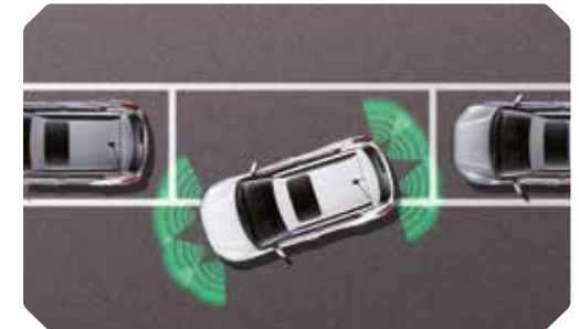
Parkeerhulp voor- en achteraan