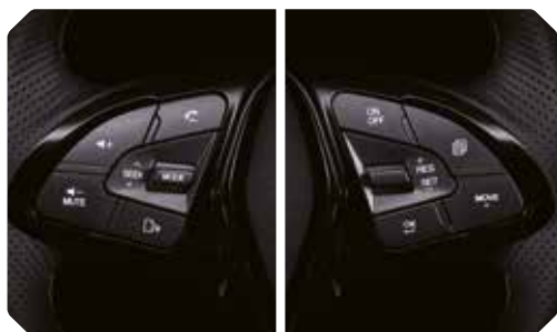
Bediening aan het stuur voor audio en cruise control