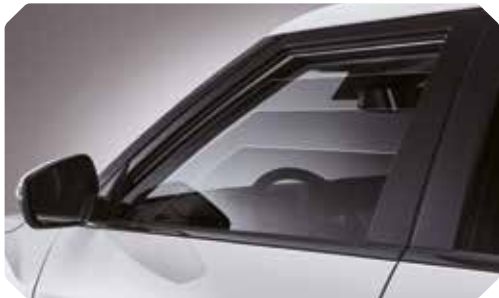
Elektrische ruit met inklembeveiliging