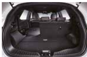
2de rij 40% neergeklapt