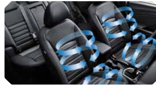
Geventileerde zetels vooraan