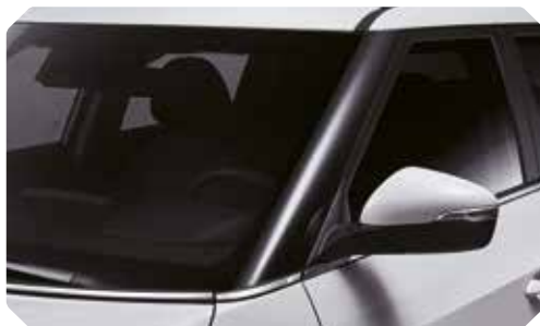
Zwarte hoogglanslak op A-stijl