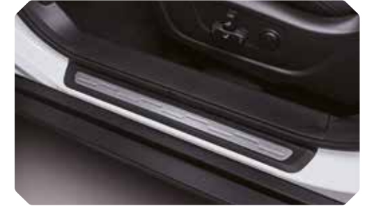
Alu deurdrempels vooraan