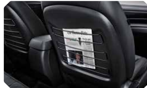
Opbergnetten aan voorzetels