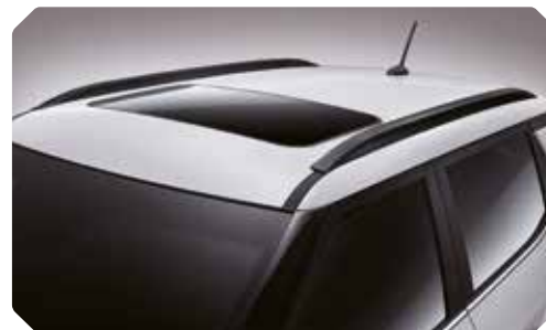
Elegante zwarte dakrails