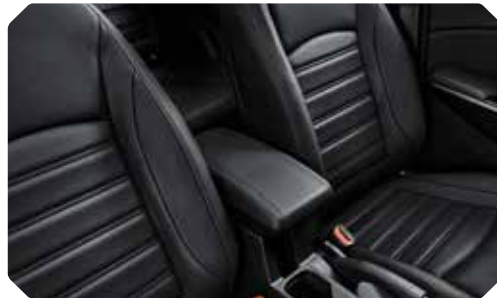
Centrale armsteun met opbergvak