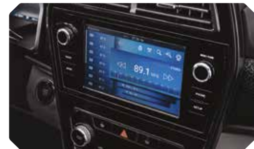
8" touch screen met radio