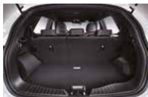
2de rij niet neergeklapt