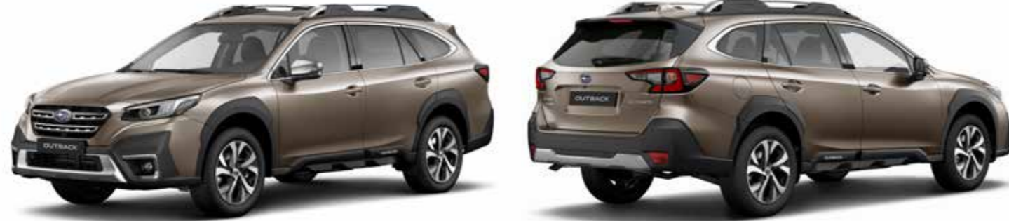
Brilliant Bronze Metallic