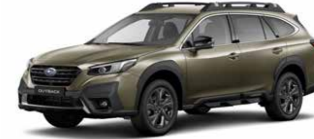
Autumn Green Metallic