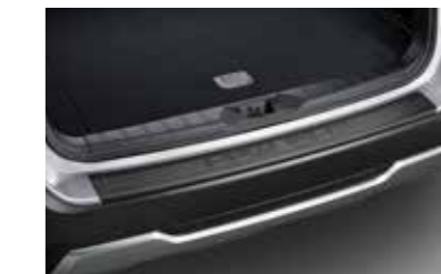
Beschermplaat tildrempel (zwarte kunststof)