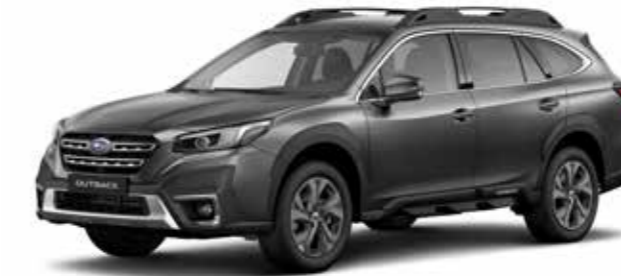
Magnetite Grey Metallic