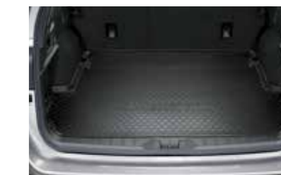
Mat bagageruimte (laag)